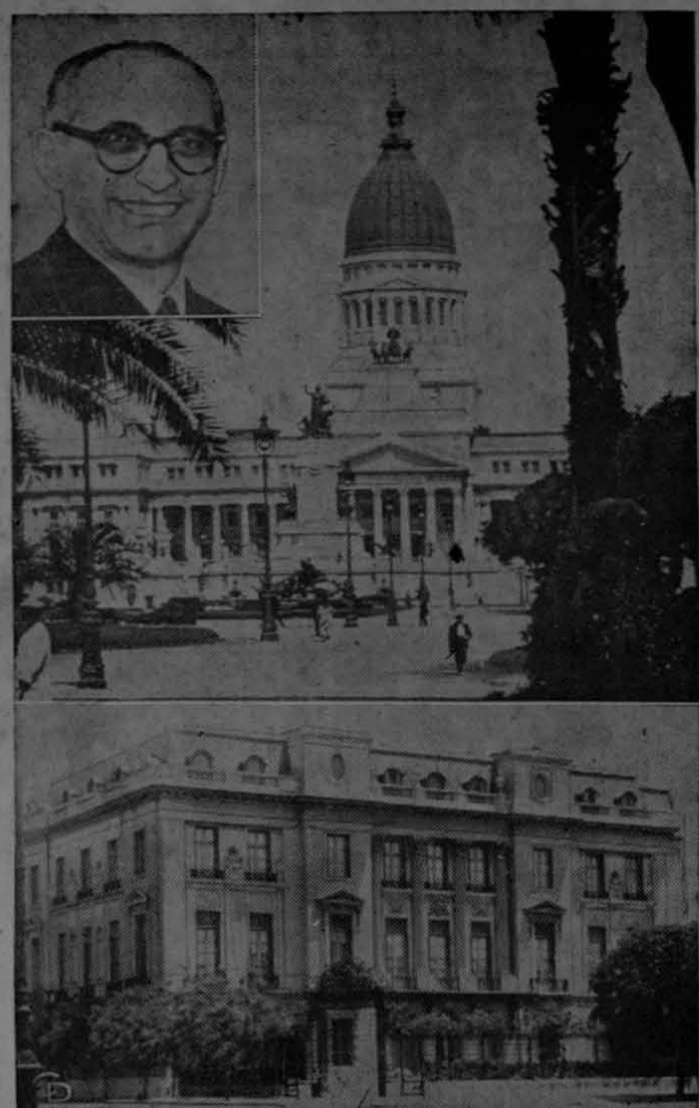
EN ARGENTINA. — El Congreso de Argentina (arriba) y la Embajada de Estados Unidos son puntos de interés para el Presidente Eisenhower y su comitiva, en Buenos Aires. Su anfitrión allí lo será el Presidente de Argentina, Arturo Frondizi (insertado). Buenos Aires, con más de 3.700.000 habitantes, es la ciudad más grande de América Latina.

(Editorial tomado de "El Libertador" de Atlitxco).